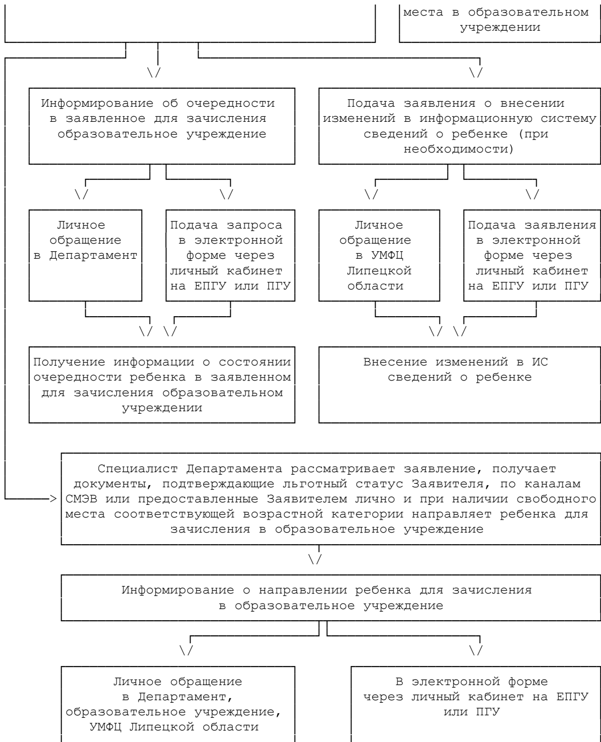
Приложение N 3 к административному регламенту предоставления муниципальной услуги "Прием заявлений, постановка на учет и направление детей для зачисления в образовательные учреждения,